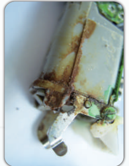
汗等の湿気により 内部がさびた状態の写真